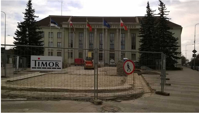
Kaitseliidu, entinen Eesti Põllumajanduse Akadeemia