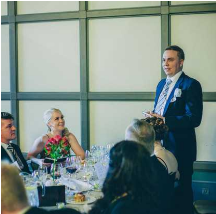
Kopra varastaa shown