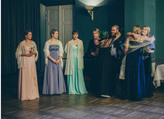
Hallitus vastaanottaa Ekyn tervehdystä