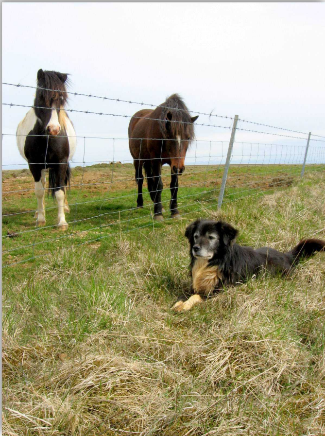
Suolet ry:n jäsenlehti Kevät 2016